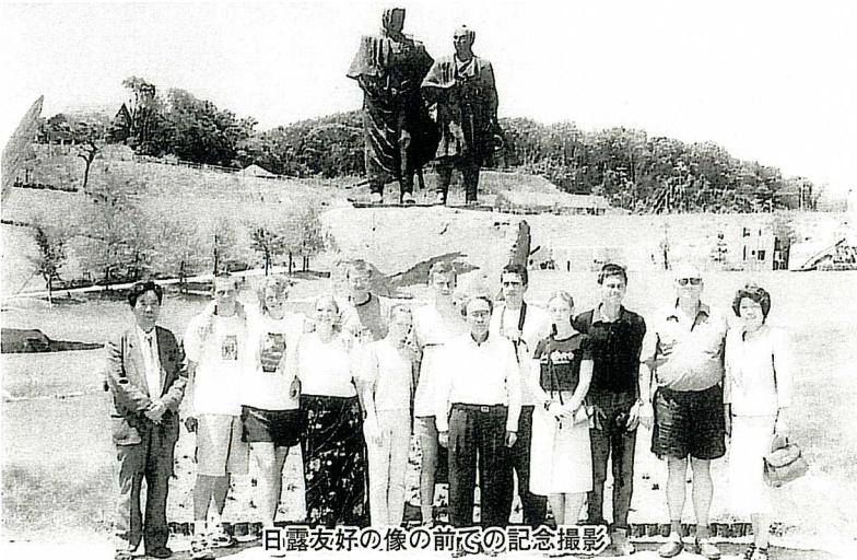
日露友好の像の前での記念撮影