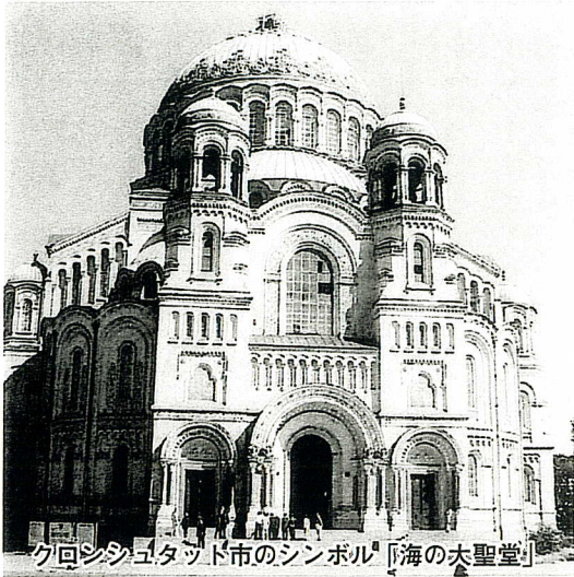
クロンシュタット市のシンボル「海の大聖堂」

1997年12月からは、市議会を中心に地方自治体が組織され、産業基盤が発達しました。船舶修理会社が一番重要な産業で、他に日用品、パン、ソーセイジ工場があります。現在の主なプロジェクトとして、港を活用したコンテナターミナルやヨットハーバーの整備、海軍基地施設および洪水調整ダムの改修などが計画されており、観光産業にも力を入れていきます。