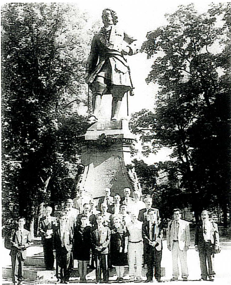
▲ ピョートル大帝の像の前で記念撮影