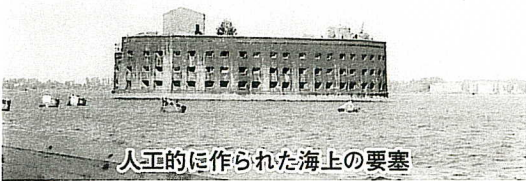
人工的に作られた海上の要塞