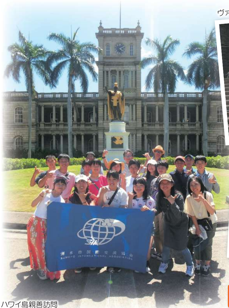
ハワイ島親善訪問