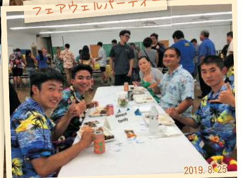
フェアウェルパーティー