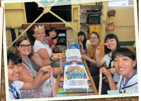
吹き戻し作りにも挑戦☆