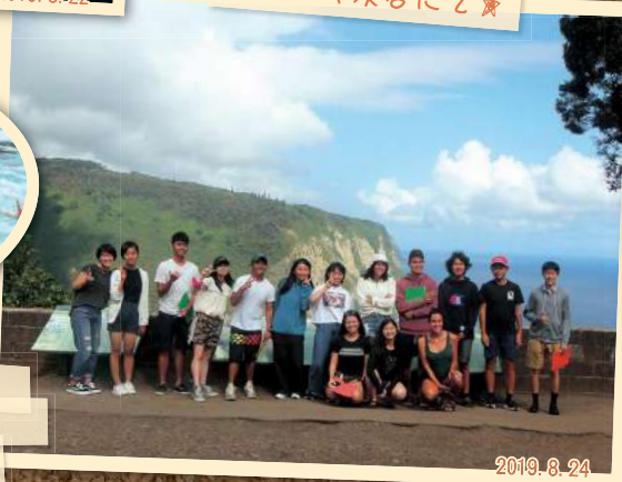
ワイピオ溪谷にて★