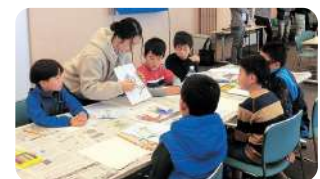
アメリカ ユアン先生