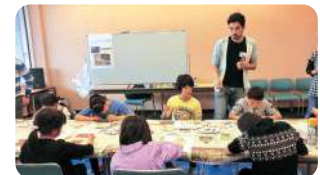
オーストラリア カイ先生

参加した小学生の皆さんは、4つの国の文化を実際に手を動かしながら真剣に学んでいました。参加者が集中して取り組んでいる様子や保護者に書いていただいたアンケート結果を見て、低年齢層における国際交流の需要が高まっていることを実感した事業となりました。