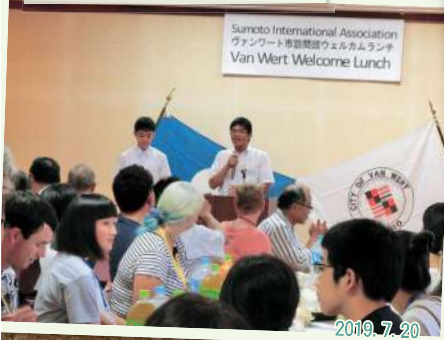
Welcome to Sumoto!