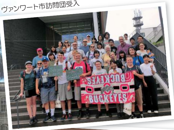
ヴァンワート市訪問団受入