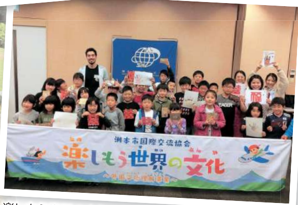
楽しもう世界の文化～外国文化理解事業～